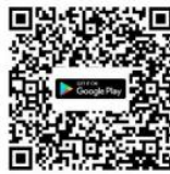
Android Android 8.0 ขึ้นไป