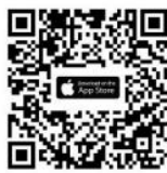
iOS iOS 14.5 ขึ้นไป